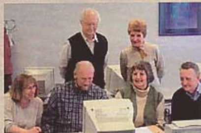
Auch in Dresden besuchten Senioren im Frühjahr Internet-Kurse

Die Dresdner Bank hat das Online-Lernangebot „Webführerschein“ entwickelt, der im Internet unter der Adresse www.dresdnerwebfuhrerschein.de kostenfrei zu nutzen ist. Außerdem werden auch Schulungen zum Webführerschein angeboten.